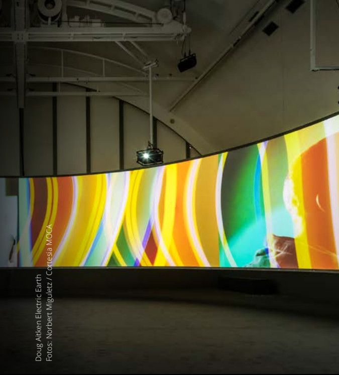
Doug Aitken Electric Earth

cas, criando paisagens visuais abissais. Criou obras como Sleepwalkers (2007), em que as paredes exteriores do MoMA foram cobertas com projeções paralelas de cinco pessoas. Em 1999, Aitken ganhou o prêmio internacional da Bienal de Veneza com a instalação electric earth . Em altered earth (2012) a paisagem em constante mudança de Arles (França) é exibida através de imagens em movimento. E para a exibição MIRROR (2013) foram utilizadas centenas de horas de imagens em tempo real, numa paráfrase ao cotidiano, transformando o exterior do Seattle Art Museum em um painel mutante.